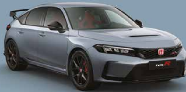
SONIC GREY PEARL