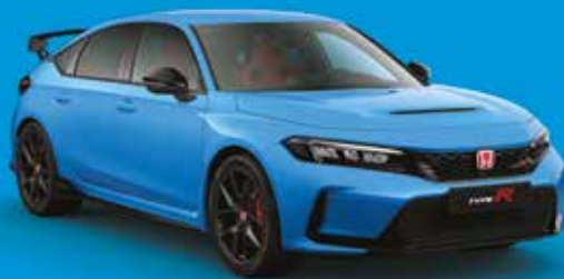
RACING BLUE PEARL